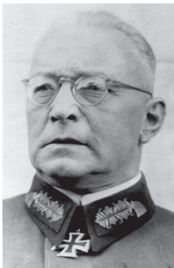
Сл. бр. 1 Генерал Франц Фридрих Беме

одмазде су спроведене према квотама 100:1/50:1, за разлику од наредби Максимилијана фон Вајкса с краја априла које су оперативно