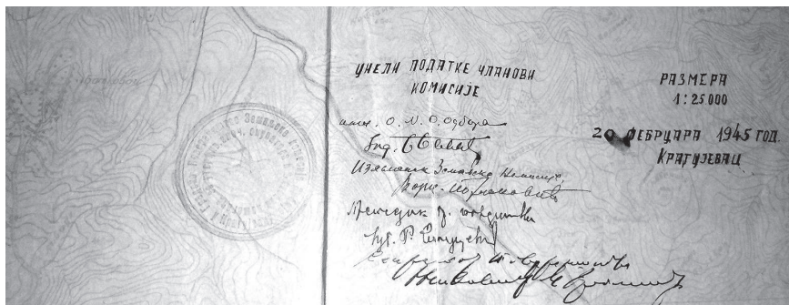
Сл. бр. 4 Потписи чланова комисије